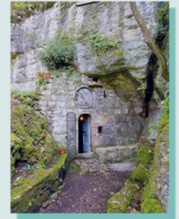
Grotta di San Filippo