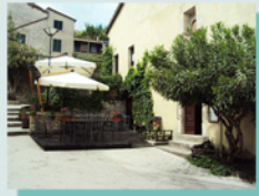
Ristorante Lo Spugnone