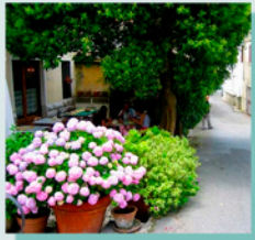
Ristorante Il Ritrovo