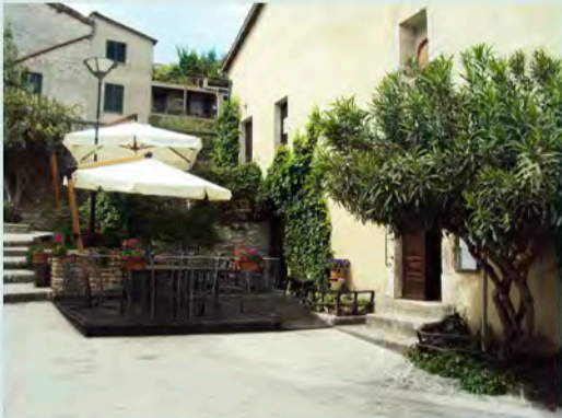
Rstorante Lo Spugnone