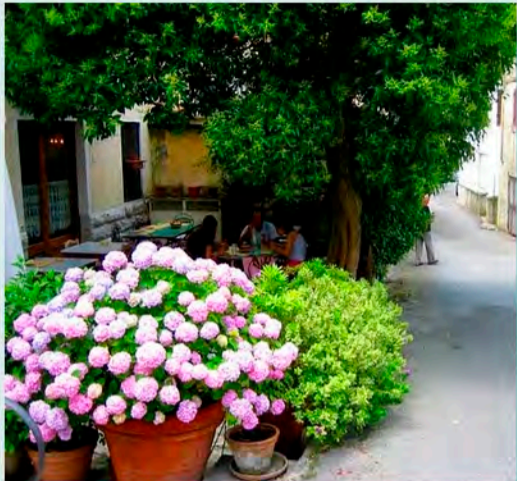
Rstorante Il Ritrovo